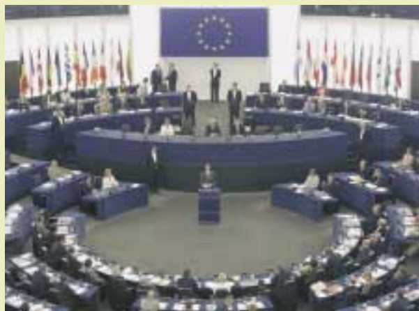
Процесс принятия Регламента

ления, зависящего от лесов. В ряде случаев прослеживается связь между нелегальными рубками и вооруженными конфликтами. Борьба с проблемой нелегальных рубок в контексте данного Регламента должна эффективно содействовать усилиям Союза по преодолению негативных последствий изменения климата и дополнить деятельность и стремления Союза в контексте Рамочной конвенции Организации Объединенных Наций об изменении климата;