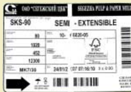
Этикетка с логотипом FSC на продукции Сегежского ЦБК