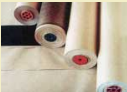
Виды крафт-бумаги, выпускаемые Сегежским ЦБК