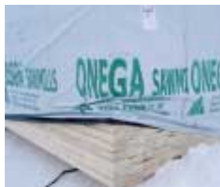
Пиломатериал сухой сертифицированный Онежского ЛДК