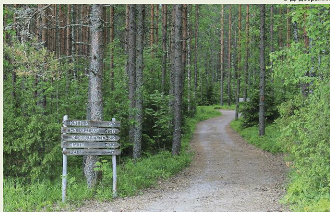
Национальный парк Нууксио, Финляндия

источником конфликтов, решение которых требует, помимо прочего, корректировки планов и исключения части лесов из освоения.