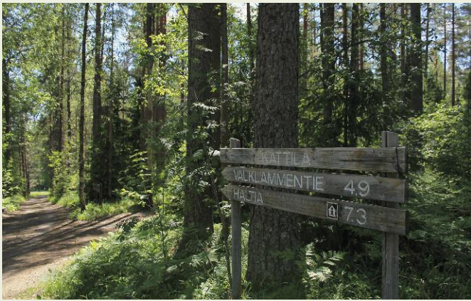
Национальный парк Нууксио, Финляндия

При этом, как известно, лесозаготовительные планы Metsähallitus обострили давние конфликты внутри самого саамского сообщества, поскольку одна группа саамов принимала эти планы (и это коммуницировалось государственной лесной службой как модель сосуществования лесного хозяйства и оленеводства), а другая — была категорически против заготовки древесины в своих лесах 1 .