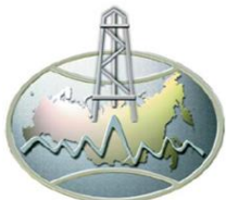
Министерство природных ресурсов и экологии РФ

Программа восстановления переднеазиатского леопарда на Кавказе реализуется Министерством природных ресурсов и экологии РФ при участии Сочинского национального парка, Кавказского заповедника, Института проблем экологии и эволюции им. А.Н.Северцова РАН, Всемирного фонда дикой природы (WWF) и Московского зоопарка.