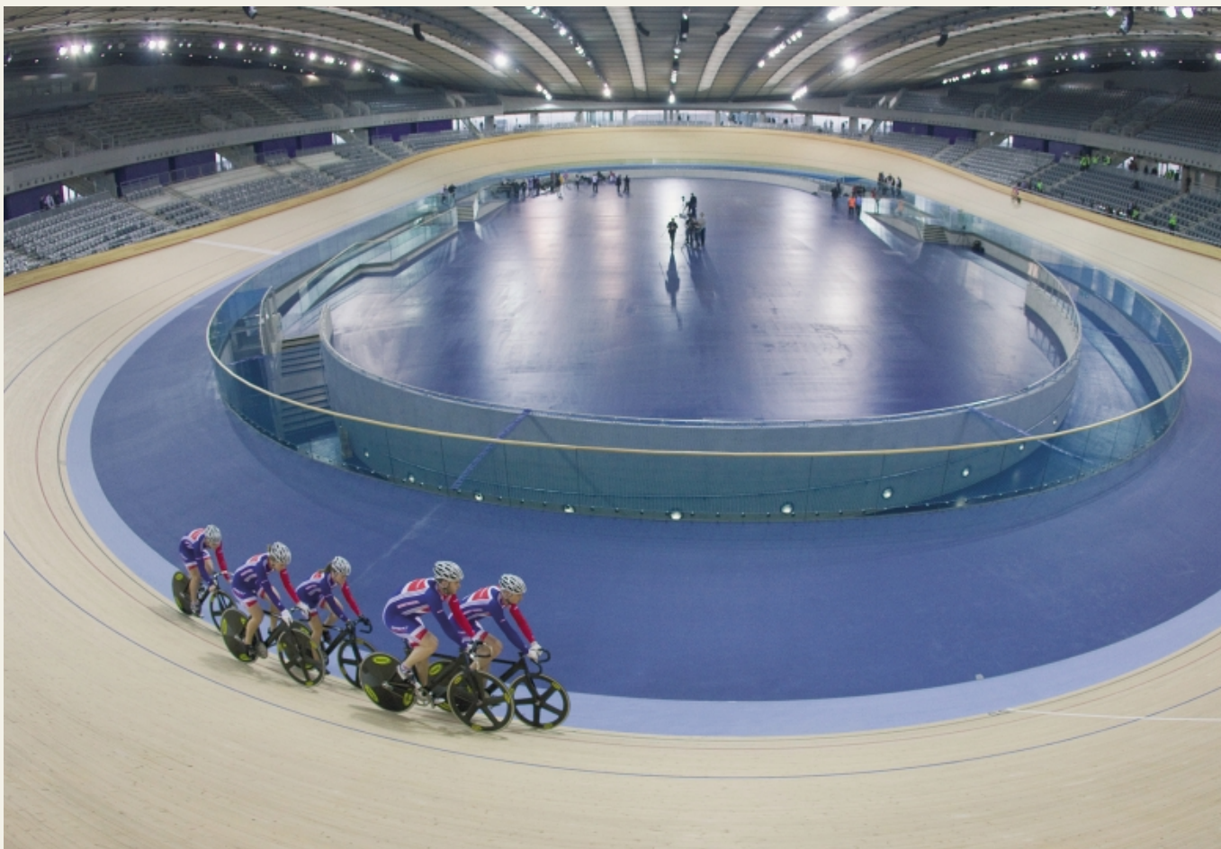
Олимпийский велотрек в Лондоне, изготовленный из FSC-сертифицированной древесины