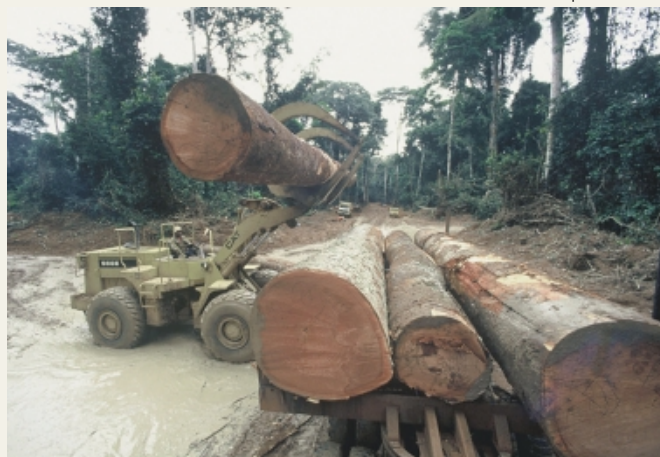
Рубка ценных пород в Конго

Высокий спрос на древесину экзотических пород является одной из предпосылок незаконных рубок в тропических странах. Поэтому важное место в исследовании ассортимента магазинов отводилось наличию изделий из древесины пород, вероятно входящих в Красный список МСОП. Как уже отмечалось выше, точно определить данный аспект было затруднительно по причине того, что у продавцов в основном отсутствует информация о видовой принадлежности продаваемых изделий из древесины. В отличие от CITES Красный список МСОП не имеет юридической силы и носит лишь рекомендательный характер. В частности, на его основе происходит обновление списка видов, защищаемых CITES. Тем не менее правомерной является постановка вопроса об этичности и экологичности торговли древесиной пород, входящих в Красный список МСОП.