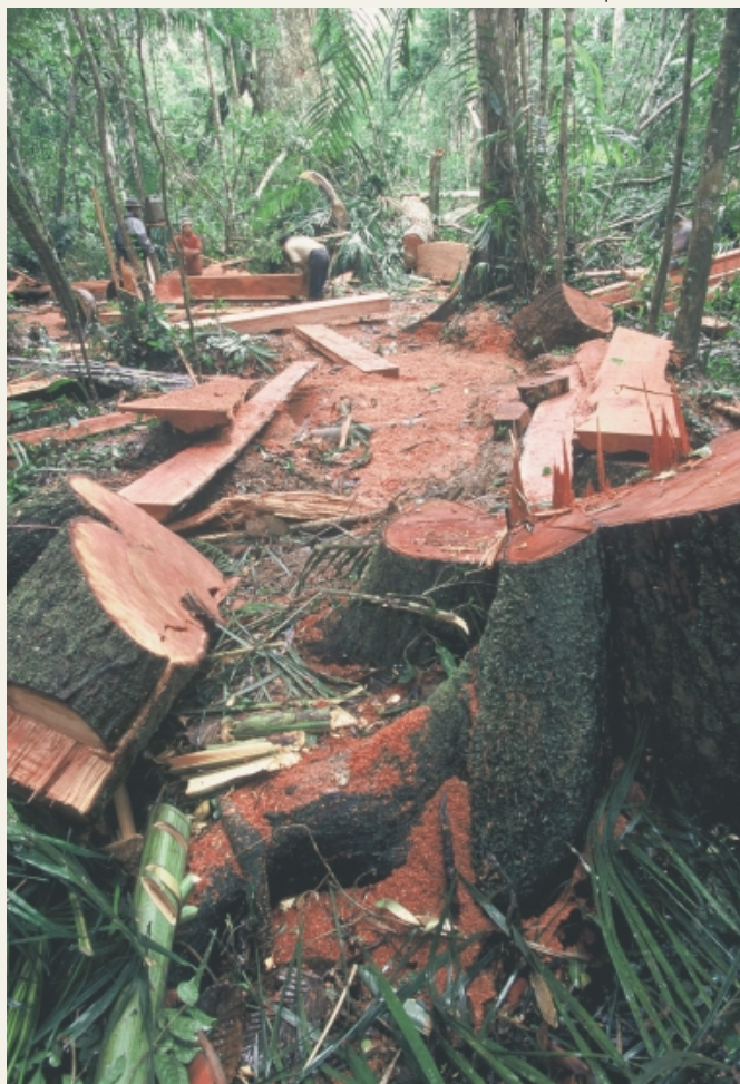
Незаконная рубка вест-индского кедра ( Cedrela odorata ) в тропических лесах Перу

Административного органа CITES выполняет Федеральная служба по надзору в сфере природопользования (Росприроднадзор).