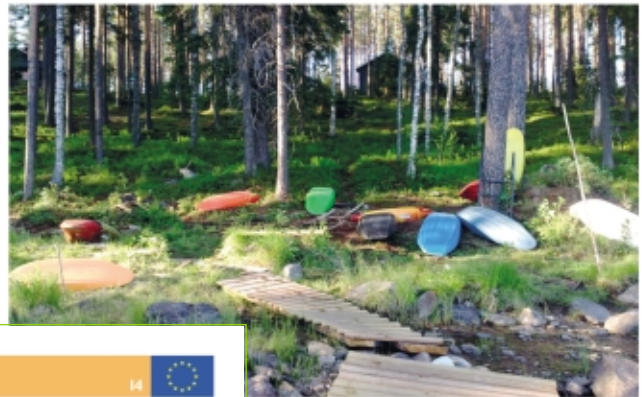
«Образовательный лесок» Сопотского заповедника, интерпретация и выкладка образовательных маршрутов Польской ФЛЭГ (БЛСР) (БЛСР) (БЛСР), WWF и WWF, Польского союза. Выделенные участки на образовательном маршруте «Лесок»