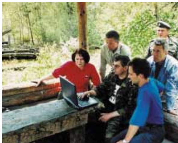
И в новом статусе «кедры» продолжают активно работать

Сегодня эти интересы совпадают, а завтра?