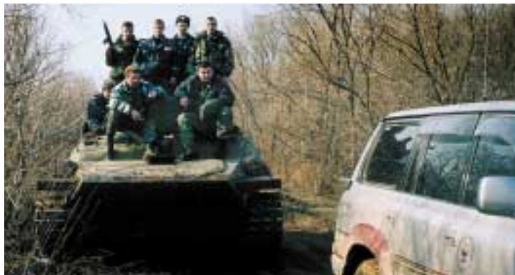
Группа «Кедр» в рейде

К счастью, новое начальство не сразу и не во всем разобралось. Становление «Кедра» и превращение небольшой бригады инспекторов в инструмент противодействия расширению лесных ресурсов края продолжалось. Почти в то же время, в конце 2000 года, Российское представительство WWF в рамках программы TRAFFIC предприняло пилотное исследование незаконных рубок и нелегального оборота леса в Приморье. Исследование заключалось в анализе данных, собранных из так называемых открытых источников: официальных отчетов Приморского управления лесами, данных таможни об объемах экспорта леса, данных территориальных статуправлений об объемах рубок и объемах перевозок и т. д. Полученные результаты выявили крайне неблагоприятную ситуацию, складывающуюся с охраной лесных