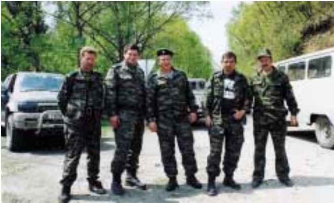
Героическим защитникам Дальневосточной тайги — инспекторам группы «Кедр» — посвящается.

Десять лет назад Всемирный фонд дикой природы (WWF) начинал свою работу в России под «флагом» охраны тигра, которого предполагалось всеми силами спасти — и в первую очередь от посягательств браконьеров. Однако почти сразу выяснилось, что такой прямой подход, мягко говоря, не совсем адекватен ситуации. Жизнь, как водится, оказалась сложнее самых сложных построений и неожиданнее самых смелых сценариев.