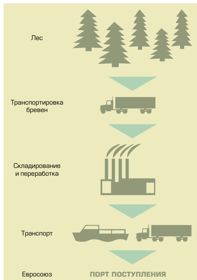
Простая цепь поставки лесопродукции