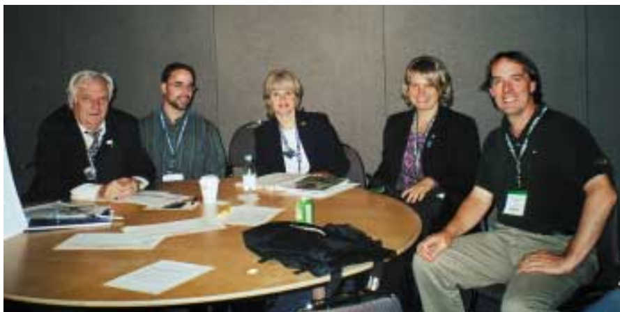
Экорегинальная сессия «Бореальные леса». «Круглый стол»

Целью экорегинальных сессий было «дойти» до каждого участника: вовлечь в дискуссию, вызвать желание поделиться своим профессиональным опытом и знаниями.