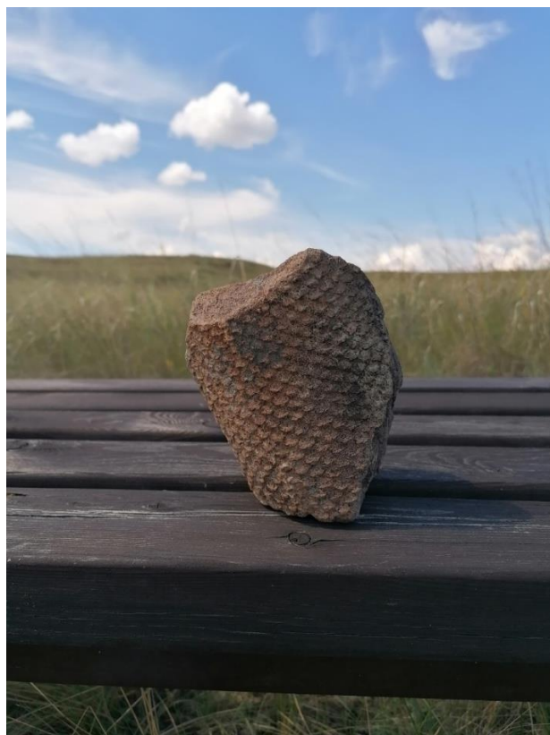
Фото 3. Ископаемое растение (предположительно Lepidodendron ). Местонахождение: Республика Хакасия., 2021