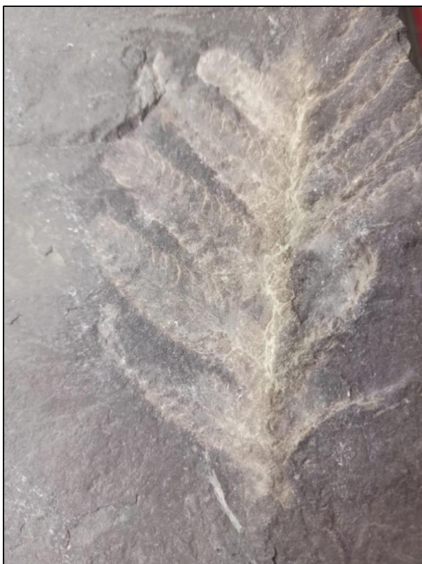
Фото 2. Ископаемое растение. Местонахождение: горный массив Оглахты, РХ., 2022