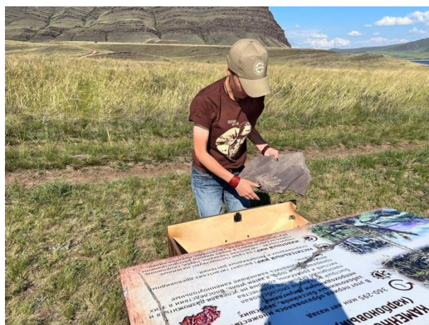
Фото 5. Комплектование маршрута объектами показа