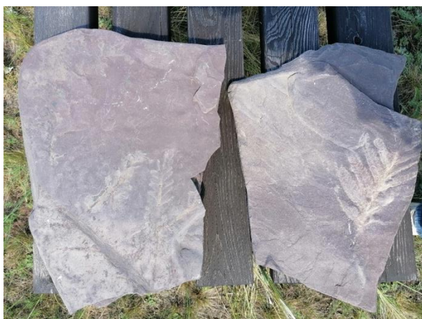
Фото 4. Ископаемые растения. Местонахождение: горный массив Оглахты, РХ., 2021-22гг.