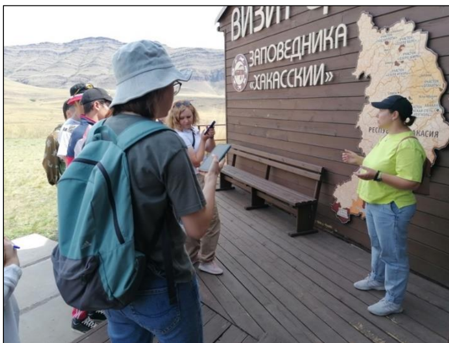
Фото 1. Знакомство экскурсоводов с участком «Оглахты»