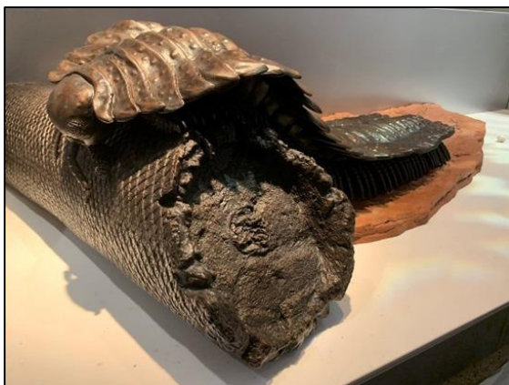
Фото 6. Релевантное решение малой архитектурной формы «Многоножка на лепидодендроне»