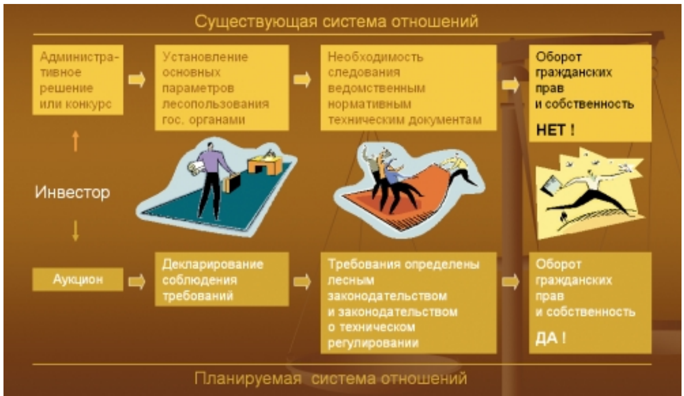
Схема 2. Принципиальные отличия пользования лесными участками (действующая и планируемая системы отношений)