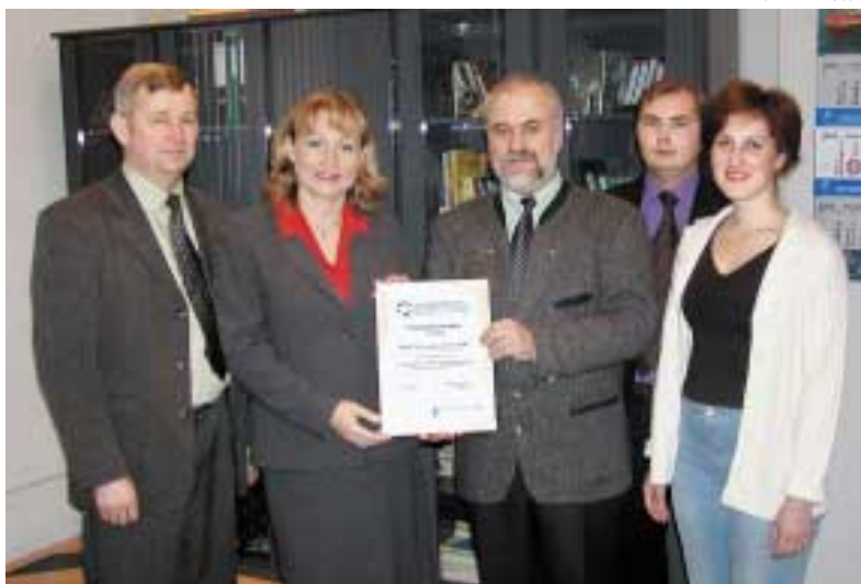
Вручение свидетельства о вступлении в Ассоциацию ОАО «Соломбальский ЛДК»

российских лесоматериалов, выделяет одного сотрудника для координации работы Ассоциации (координатора) и одного — в состав правления Ассоциации.