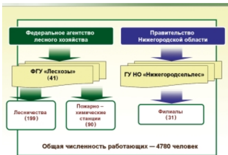
Рис. 4. Структура лесопользования до 1 января 2007 г.