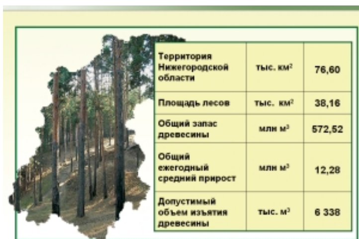
Рис. 1. Общая характеристика лесов Нижегородской области

Вовремя принятые меры, основанные на профилактике лесных пожаров и своевременном их обнаружении, позволили в чрезвычайных пожароопасных условиях 2007 г. не допустить распространения огня на значительные площади. Всего с наступлением пожароопасного периода на территории области возникло 700 лесных пожаров, площадь, пройденная огнем, составила 722,2 га (рис. 2).