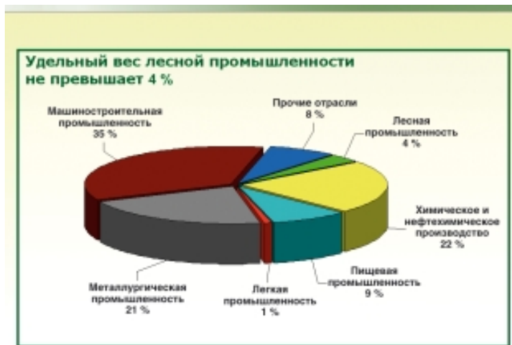
Рис. 3. Состав валового регионального продукта

На втором этапе осуществлено преобразова-