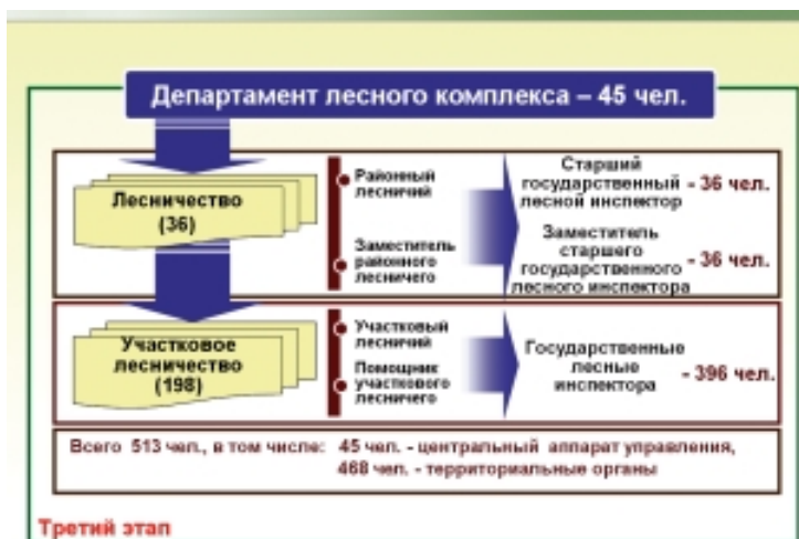
Рис. 7. Формирование районных и участковых лесничеств — территориальных органов департамента