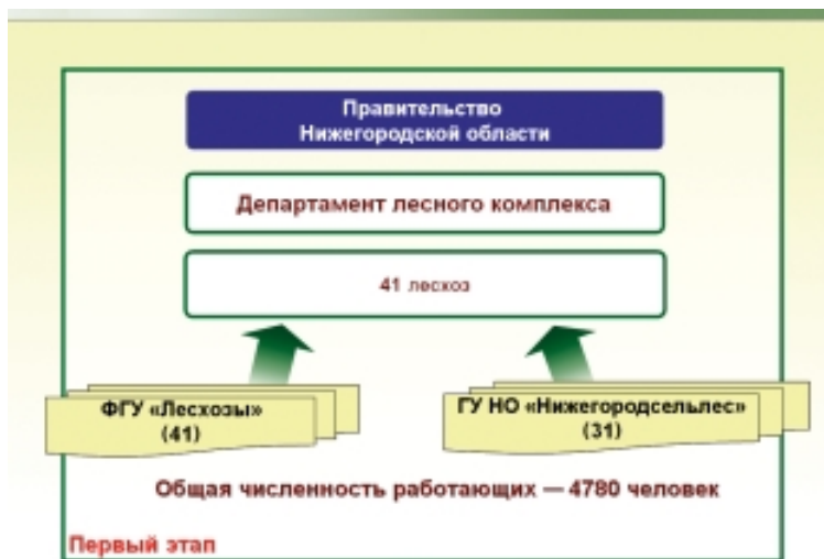
Рис. 5. Обеспечение единства лесопользования в границах муниципального образования