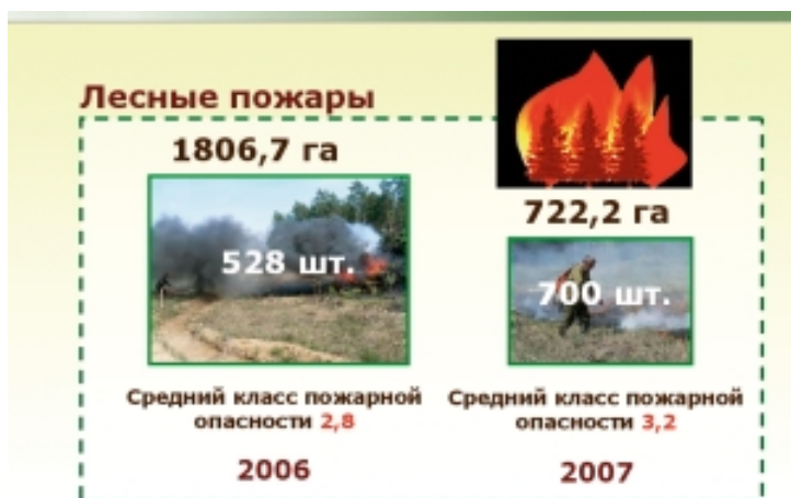
Рис. 2. Исполнение переданных полномочий