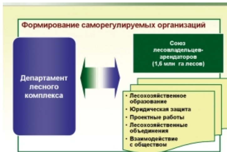
Рис. 10. Совершенствование организации управления лесами

зователя как равного государству партнера в новых лесных отношениях. Фактически та роль лесхозов, которую они сегодня играют на территориях переданных в аренду, за исключением функций контроля и надзора, переходит к арендатору. От способности лесопользователя (арендатора) к ведению лесного хозяйства, скорейшего приобретения им лесных знаний, кадров и технологий зависит успех проводимых реформ.