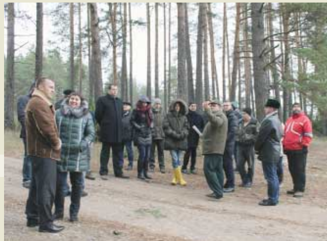
Экскурсия на лесной участок