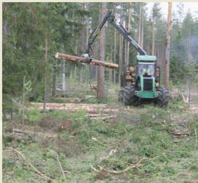
На лесном участке