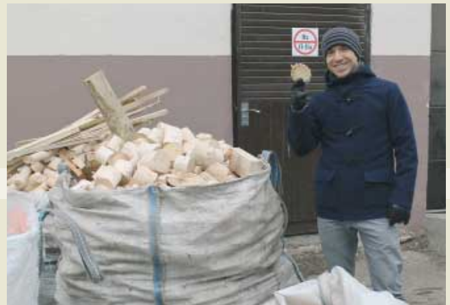
На белорусском предприятии лесной отрасли