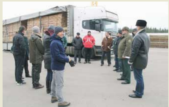
Экскурсия на предприятие лесной отрасли