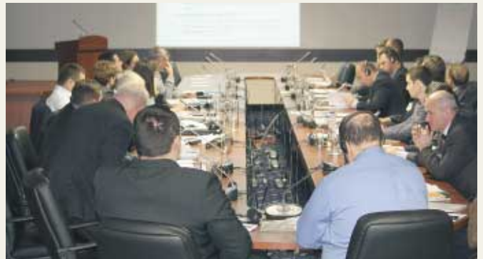
Заседание «круглого стола»

Регламент (ЕС) № 995/2010 Европейского парламента и Совета от 20 октября 2010 года об обязанностях операторов, размещающих лесоматериалы и продукцию из древесины на рынке (далее — Еврорегламент), который введен в действие в марте 2013 года, разработан на основе Плана действий ЕС по правоприменению, управлению и торговле в лесном секторе (ФЛЕГТ), принятого в 2003 году. С помощью Еврорегламента создан нормативный механизм, направленный на прекращение торговли незаконной древесиной или лесоматериалами на рынке ЕС, содействие сокращению влияния ЕС на уничтожение лесов и поддержку законных методов лесозаготовок. В настоящее время осуществляется пересмотр