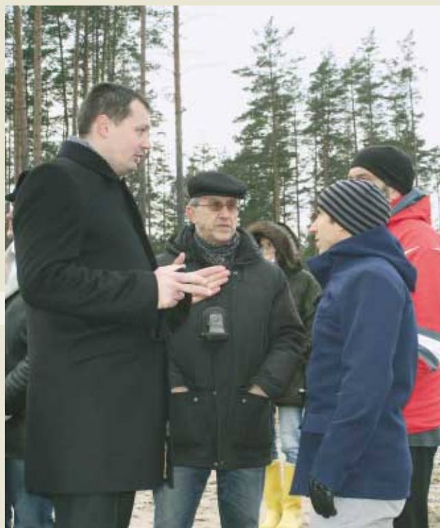
Общение во время экскурсии