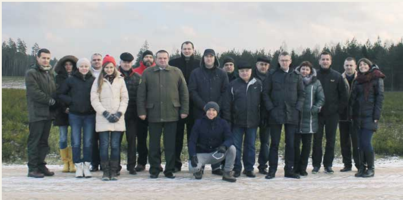
Участники «круглого стола»