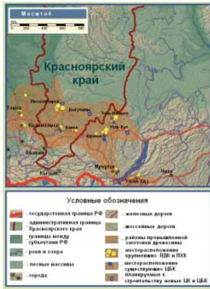
Рис. 1. Лесопромышленный комплекс Восточной Сибири

На данный момент в крае перерабатывается лишь половина заготавливаемой древесины, а оставшаяся часть вывозится в соседние регионы и за границу. Власти региона путем привлечения значительных инвестиций надеются изменить сложившуюся