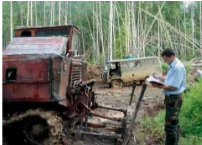
Рис. 4. Изъятие трактора с места незаконной порубки леса

Анализируя экономическую обстановку на территории района с 2003 г., можно отметить, что преступления, связанные с незаконными рубками леса занимают верхнюю строку в списке выявленных преступлений экономической направленности. Выявление указанной категории преступлений неуклонно растет на протяжении последних 5 лет, что прежде всего необходимо связывать с усилением внимания правоохранительных органов к этой проблеме и наработкой новых методов борьбы. Это же находит отражение в таблице, где показана активность в обнаружении лиц совершивших порубки, доказывании их вины и тем самым направлении дела в суд для привлечения виновных лиц к уголовной ответственности, предусмотренной ст. 260 УК РФ.