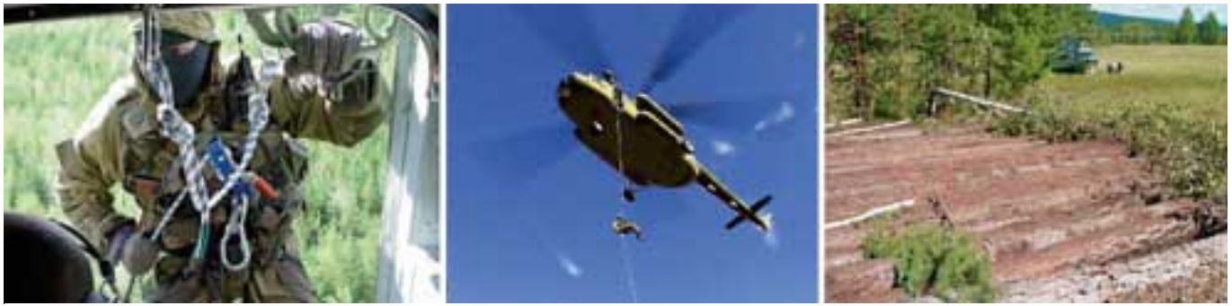
Рис. 3. В марте 2007 г. у милиции Красноярского края появился собственный авиаотряд, который сразу же стал привлекаться к мероприятиям, направленным на борьбу с нелегальным оборотом древесины

да возросло количество лиц, привлеченных к уголовной ответственности за правонарушения в лесной отрасли — 108 человек (за аналогичный период 2006 г. — 48 человек). Ущерб от выявленных незаконных порубок за 11 месяцев 2007 г. составил 169,7 млн руб. (за аналогичный период 2006 г. — 157,1 млн руб.).