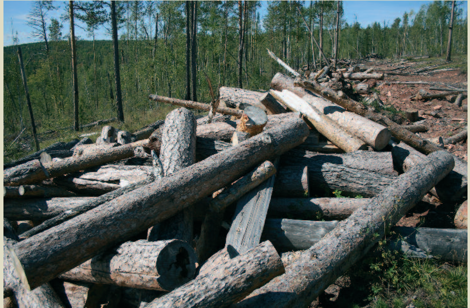
Брошенная древесина на лесосеке в Иркутской области