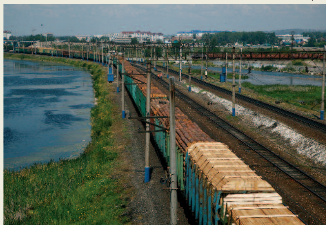
Эшелон из Иркутска перед отправкой в Китай