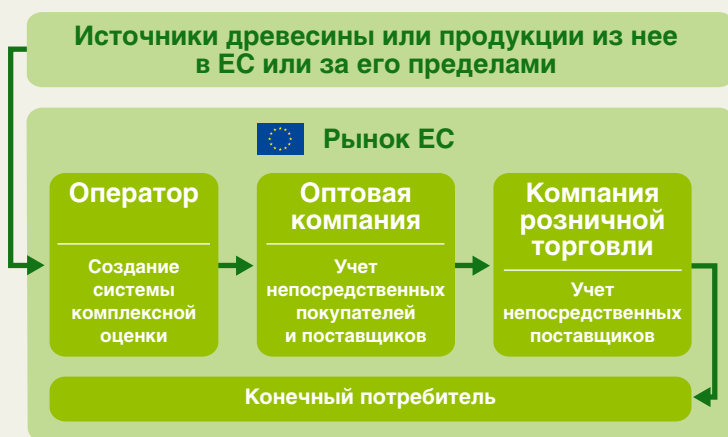
Рис. 1. Цепочка поставок древесины или продукции из нее в ЕС

В настоящее время Европейская Комиссия и государства — члены ЕС ведут работу по уточнению и детализации Регламента, так что возможны определенные изменения в правилах до его вступления в силу в марте следующего года. Подробная информация приведена на сайте Европейской Комиссии: http://ec.europa.eu/environment/forests/timber_regulation.htm