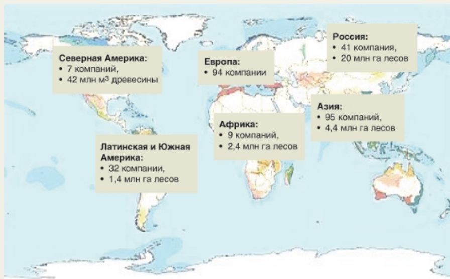
Рис. 1. Члены GFTN

WWF, не являясь участником рыночной деятельности, два десятилетия назад стал посредником и главным партне-