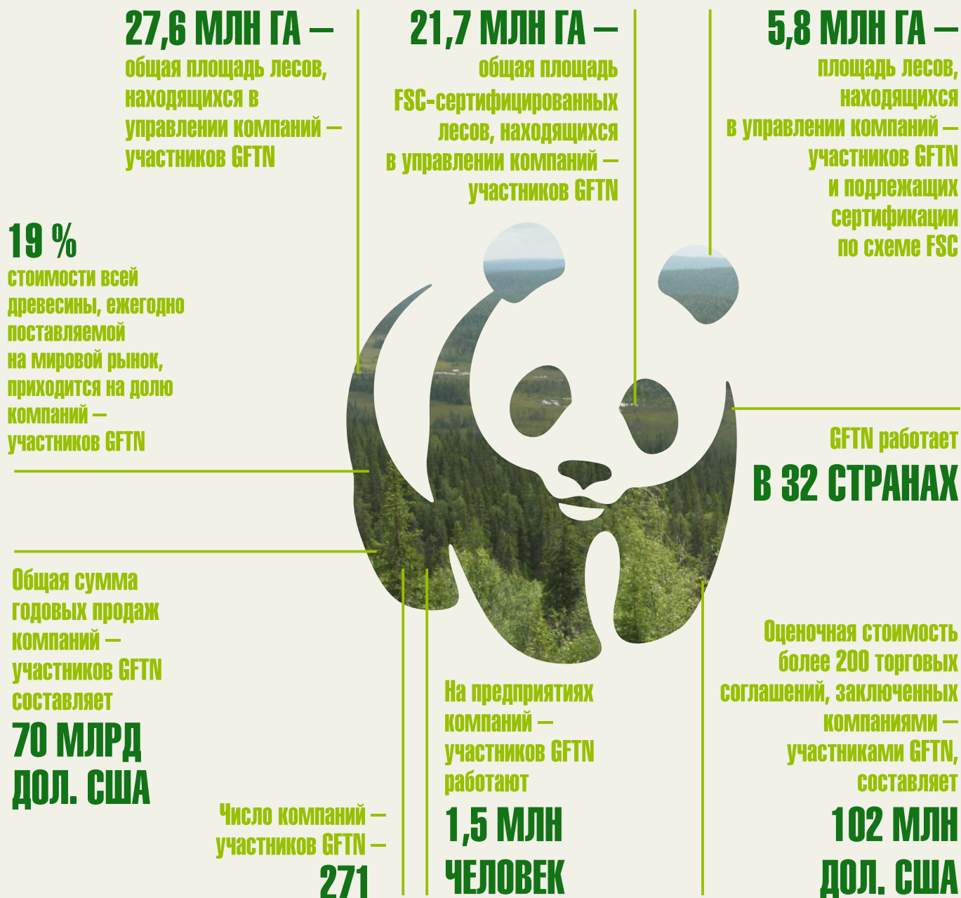
Рис. 2. GFTN на мировом рынке

редких видов в век коммерции и непомерного потребительского спроса.