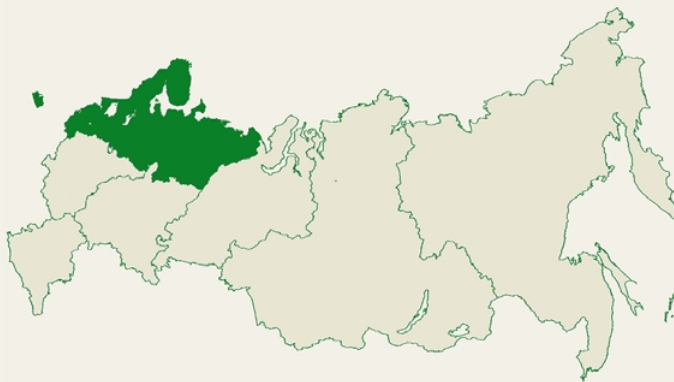
Таблица 1. Северо-Западный федеральный округ. Сводная таблица, %