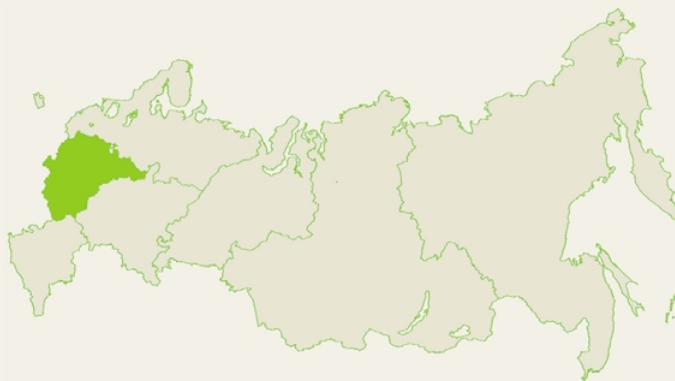
Таблица 1. Центральный федеральный округ. Сводная таблица, %