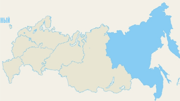
Таблица 1. Дальневосточный федеральный округ. Сводная таблица, %