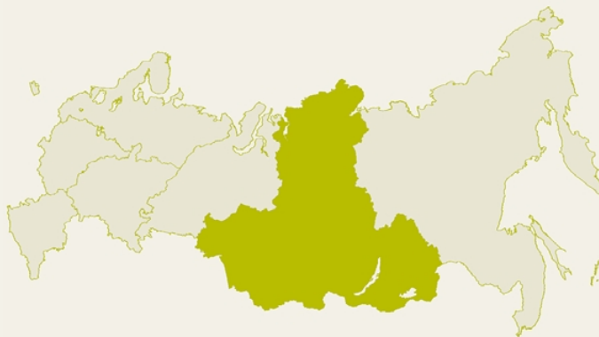
Таблица 1. Сибирский федеральный округ. Сводная таблица, %