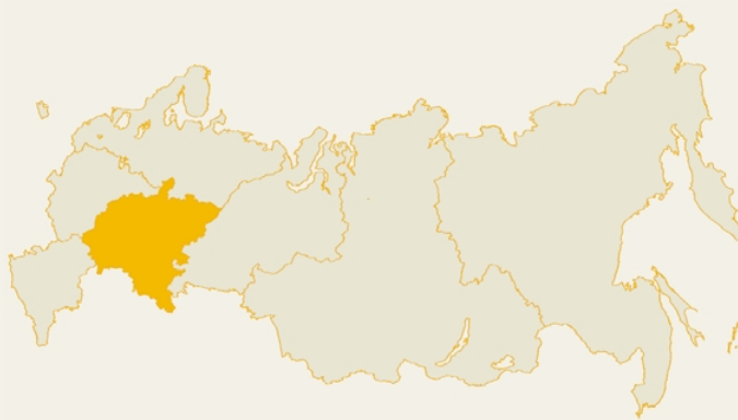
Таблица 1. Приволжский федеральный округ. Сводная таблица, %