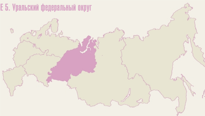
Таблица 1. Уральский федеральный округ. Сводная таблица, %