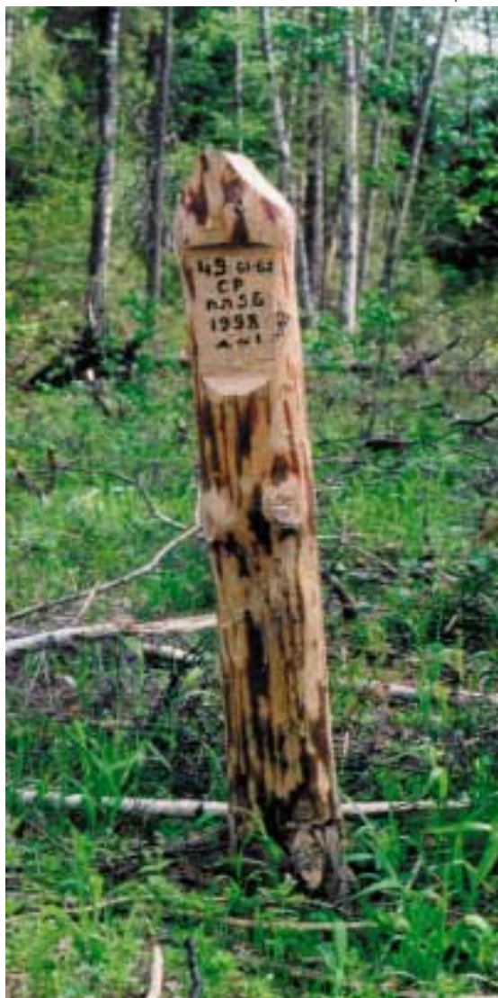
При аудите делянки проверяется соответствие информации на деляночном столбике и в лесорубочном билете

Оценка системы третьей независимой стороной прибавляет системе доверия и надежности, а также помогает выявить недостатки, которые могли остаться незамеченными.