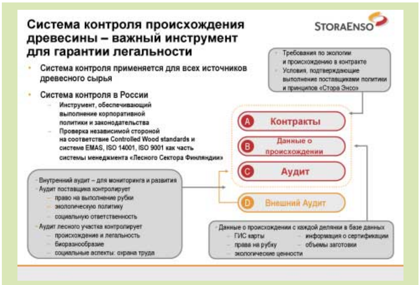
Рис. 1. Система контроля происхождения древесины концерна «Стора Энсо»