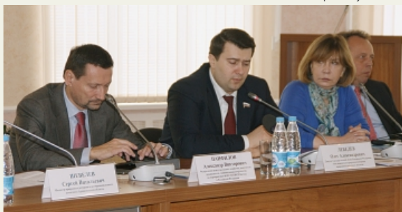
На заседании «круглого стола» Всемирного банка в Архангельске