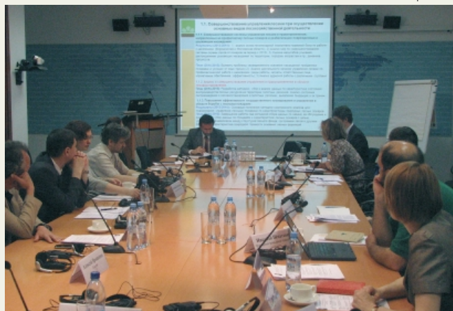
Заседание НККП ФЛЕГ II в Москве

14 мая 2014 года в московском представительстве Всемирного банка состоялось заседание Национального консультационного комитета (НККП) программы ФЛЕГ II. В ходе заседания были рассмотрены и согласованы измене-