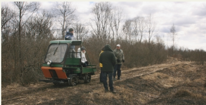
Местный житель из д. Цевло планирует организовывать экскурсии на дрезине по старой узкоколейной дороге