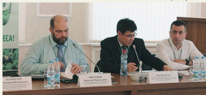
На заседании «круглого стола» WWF в Архангельске