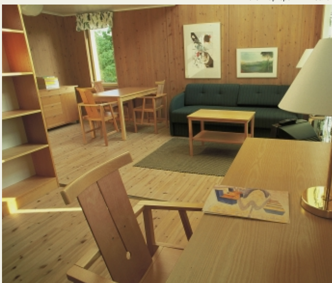
Дом, в котором 90-% использованной древесины сертифицировано по схеме FSC (Стокгольм, Швеция)

могут обеспечивать высокий уровень контроля легальности древесины, сертификация по схеме Лесного попечительского совета (FSC) служит и для поставщиков, и для самих арендаторов лучшим инструментом гарантии европейским партнерам наличия всех документов, требуемых в рамках Еврорегламента для подтверждения легальности. Сертификация помогает поставщикам обеспечить соответствие требованиям не только Еврорегламента, но и Закона Лейси и австралийского закона о борьбе с незаконными рубками, поскольку эти три законодательных акта, различаясь в требованиях, преследуют одинаковые цели. Кроме того, сертификация демонстрирует большую приверженность ответственному лесоуправлению, что выходит за рамки обеспечения легальности и служит реальным вкладом в сохранение лесов планеты.