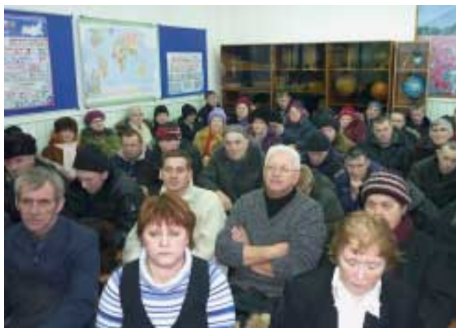
Рис. 1. Общественные обсуждения в п. Новое Машозеро

Общественные обсуждения в Н. Машозеро и Тунгуде проводились в очень сжатые сроки и произошли в один и тот же день (рис. 1). Первоначально у компании было намерение