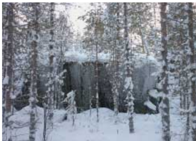
Рис. 5. Скальные выходы — ЛВПЦ 3 (редкая экосистема, выделенная экспертами)

В рассмотренном случае жалобы заинтересованных сторон шли параллельно и от разных лиц в различные инстанции без соблюдения какой-либо иерархии. Выделение ЛВПЦ представляет собой открытый диалог заинтересованных