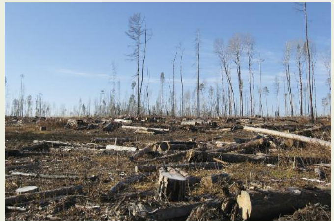
Вырубка на территории заказника «Туколонь»

Согласно Правилам осуществления мероприятий по предупреждению распространения вредных организмов (2016) в спелых и перестойных насаждениях в эксплуатационных лесах выборочные санитарные рубки не проводятся (п. 37). Таким образом, несмотря на то, что заказник относится к ООПТ, спелые и перестойные насаждения на его территории при назначении СОМ могут вырубаться лишь в порядке сплошных санитарных рубок.