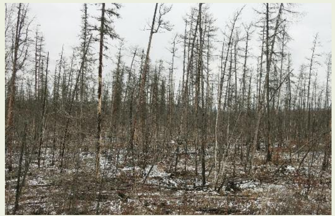
Погибший в результате пожара древостой на территории заказника «Туколонь»

Государственный природный заказник регионального значения «Туколонь», как и многие сибирские заказники, создан в середине 1970-х годов сроком на 10 лет в целях усиления охраны и воспроизводства диких животных на площади 200,5 тыс. га с изъятием территории из существовавшего на тот момент Казачинского коопзверопромхоза 3 , но без изъятия из состава государственного лесного фонда. В дальнейшем срок действия заказника продлевался, а с 2007 года он приобрел статус постоянно действующего. При этом площадь его уменьшилась до 109,6 тыс. га. Целями его создания в редакции действующего Положения о государственном природном заказнике регионального значения «Туколонь» 4