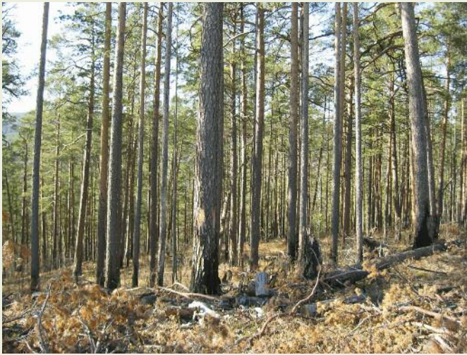
Сохранившийся сосновый древостой в заказнике «Туколонь» по границе с вырубкой

которая априори не предполагает активного вмешательства человека не только в их состояние, но и в ту естественную их динамику, которая во многом определяется в условиях региона воздействием лесных пожаров. С другой стороны, СОМ, предусматривающие проведение рубок, в том числе сплошных, противоречат цели создания заказника и тем самым порождают потенциальный конфликт.