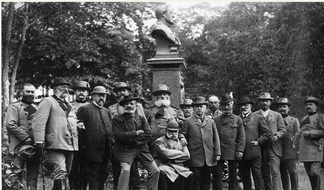
Основатели ИЮФРО: участники встречи-заседания Ассоциации лесных опытных станций и учреждений Германии, Австрии и Швейцарии в Эберсвальде (Германия), 1892 год