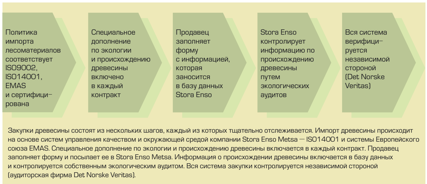
Рис. 2. Система отслеживания происхождения продукции компании Stora Enso в России

тойчивости. Таким образом, FSC-продукция уже сегодня соответствует требованиям ЕС в отношении легальности и ответственного лесопользования и может обеспечить выполнение обязательств РФ в случае подписания соглашения FLEG(T).