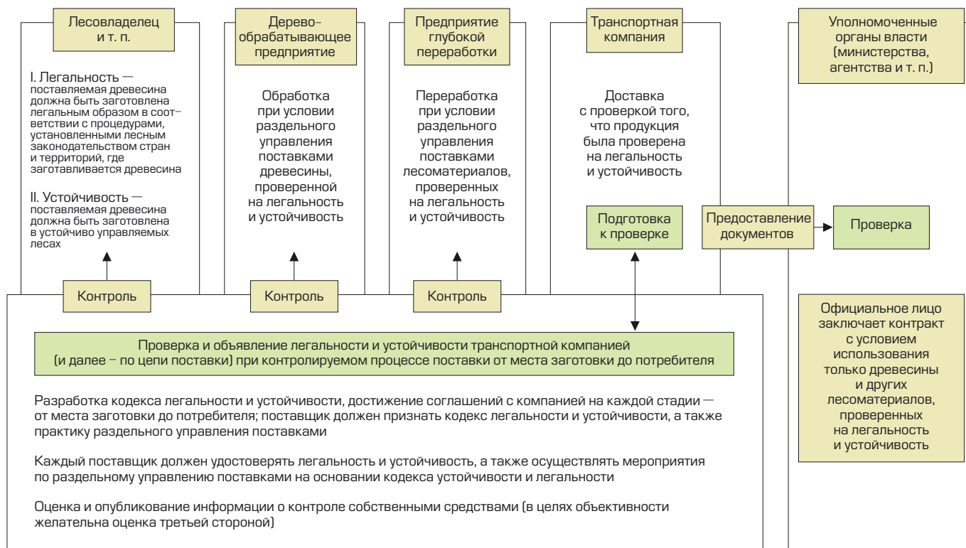
В случае, если древесина импортирована, экспортеры следуют схеме 1