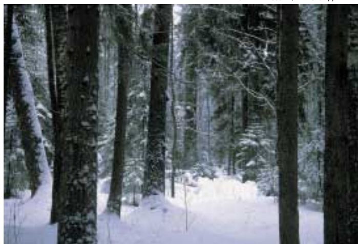
Бореальные лесные экосистемы России обладают энергетической хрупкостью, развиваясь на вечномерзлотных почвах в условиях резко континентального климата

Новая лесная политика должна обеспечить на основе устойчивого управления лесами контроль за соблюдением баланса сегодняшних интересов и возможных потребностей будущих поколений. Лучшим способом реализации государственных гарантий в этой области, по нашему мнению, является воссоздание независимого федерального органа — Министерства лесного хозяйства России, а с ним и централизованной государственной системы управления лесным доходом. Именно этому органу надлежит формировать национальную лесную политику. Только в этом случае государство может рассчитывать на получение истинной цены за национальную собственность — лесные ресурсы и продукты их переработки. Нужно приумножать леса России, а не распродавать их за полцены!