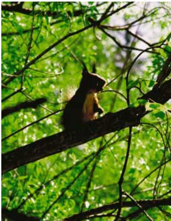
Сохранение биоразнообразия — одна из основных целей УУЛ