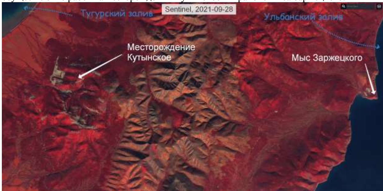
Фото 1. Космоснимок от 28 сентября 2021 года со спутника Sentinel показывает осуществление работ на месторождении Кутынское и в районе мыса Заржецкого.