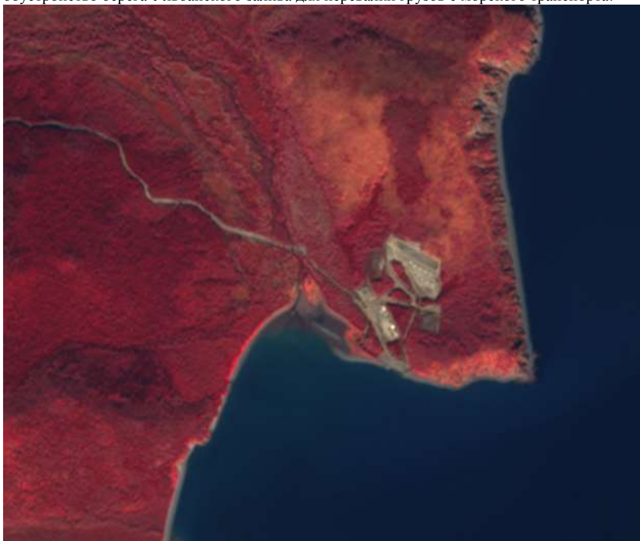
Фото 2. Космоснимок от 28 сентября 2021 года со спутника Sentinel. Мыс Заржецкого, обустройство берега Ульбанского залива для перевалки грузов с морского транспорта.